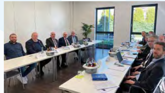
Die Teilnehmer der ersten Runde in den Verhandlungen im Kfz-Gewerbe Nordrhein-Westfalen 2026. Links im Bild sind die Vertreter der CGM, rechts die Arbeitgebervertreter.

Nicht von der Kündigung betroffen sind die in diesem Bereich tätigen Auszubildenden. Der separat geschlossene Tarifvertrag über Ausbildungsvergütungen ist noch bis Ende Juli 2026 gültig.