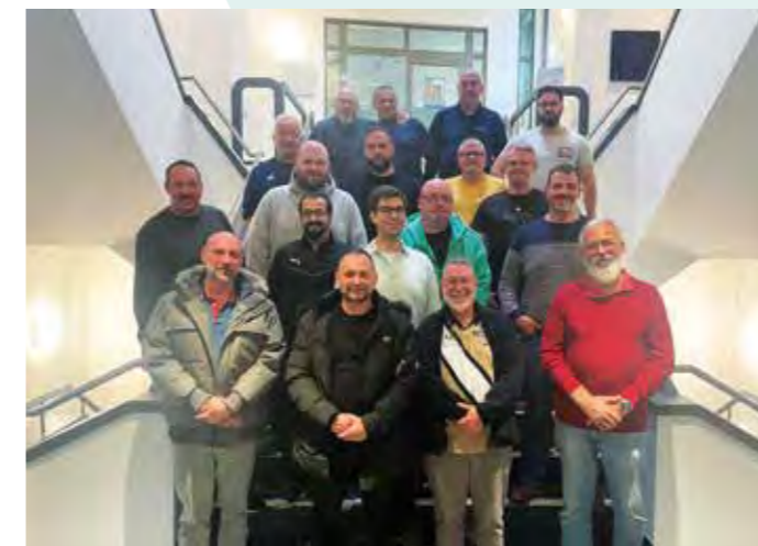
Die FRBW-Teilnehmer der Schulung in Kirkel